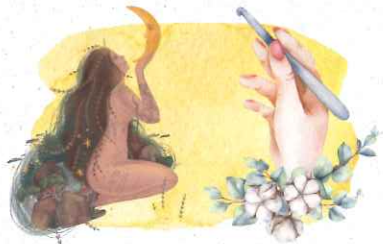
ハンドメイド・体験コーナー レザークラフト・マヤ暦鑑定