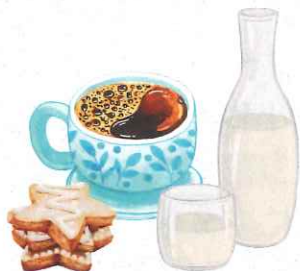
ホットコーヒー・甘酒 クッキー付き