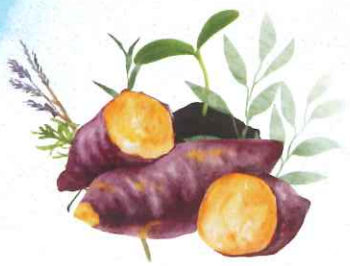
オーガニック さつまいも・ハーブ苗