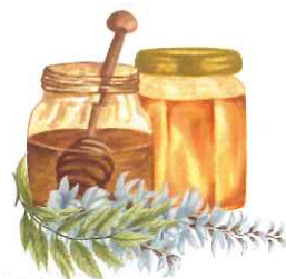
奥阿蘇産はちみつ