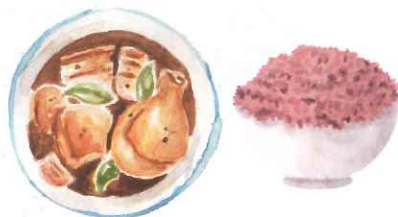
だご汁・お赤飯 ひじき煮